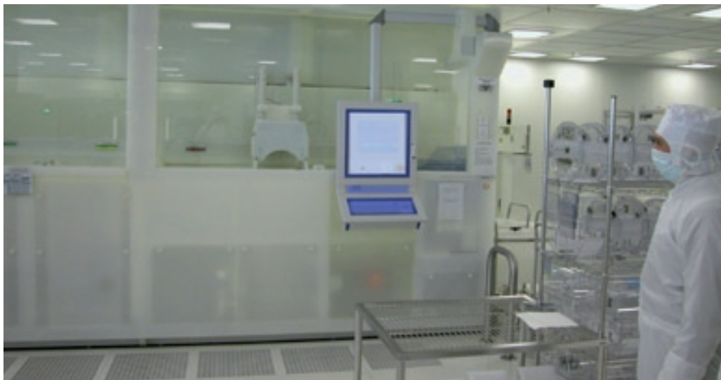
Abb. 2: Gestaltungsanonymität wie auch fehlende optische Reize führen zur schnelleren Ermüdung und Konzentrationsproblemen.